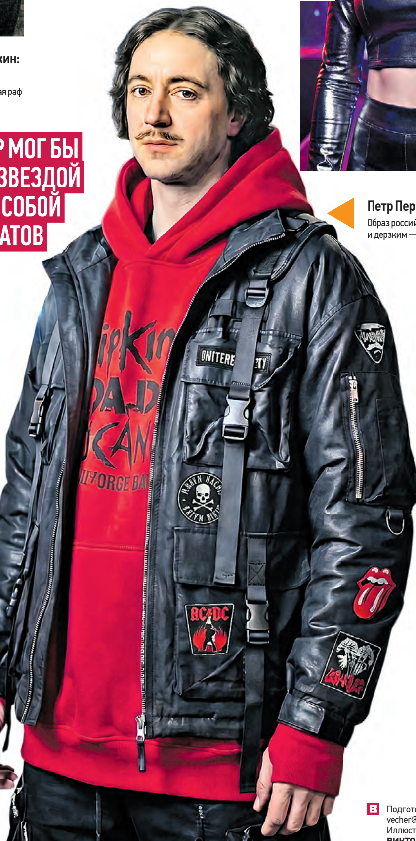
Петр Первый: неформал

Композитор стал диджеем. Над сценическим именем не заморачивался — назвался dj Mozart