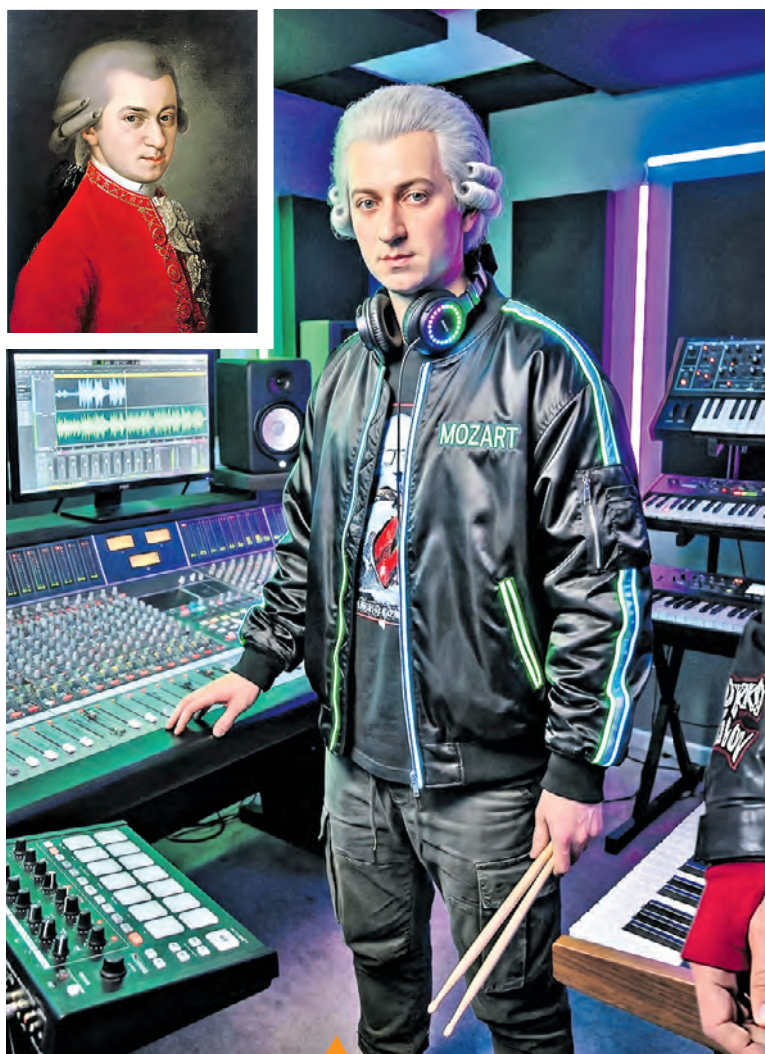
Вольфганг Амадей Моцарт: диджей

ИМПЕРАТОР МОГ БЫ БЫТЬ РОК-ЗВЕЗДОЙ И ВЕСТИ ЗА СОБОЙ ТОЛПУ ФАНАТОВ