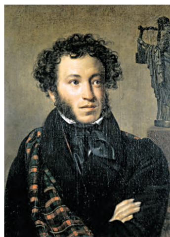
Александр Пушкин: фрилансер Сочиняет стихи, попивая раф на кокосовом молоке