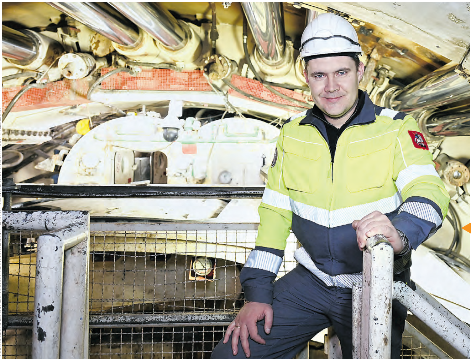
МОСИНПРОЕКТ, ПРЕСС-СПУЛНЕВА МОСКВААРХИТЕКТУРЫ, ТОТЕМЕНТ/РАПЕР, СТРОИМОС.RU, АГЕНТСТВО «МОСКВА», АНАТОЛИЙ ЦЫМЕАЛОК

Сегодня 90 процентов жителей Москвы проживают в зоне доступности рельсового транспорта. К 2030 году этот показатель вырастет до 93 процентов — будут открыты около 30 новых станций метро, а также три электродепо для обслуживания поездов: «Троицкое», «Бирюлевское» и «Новорижское».