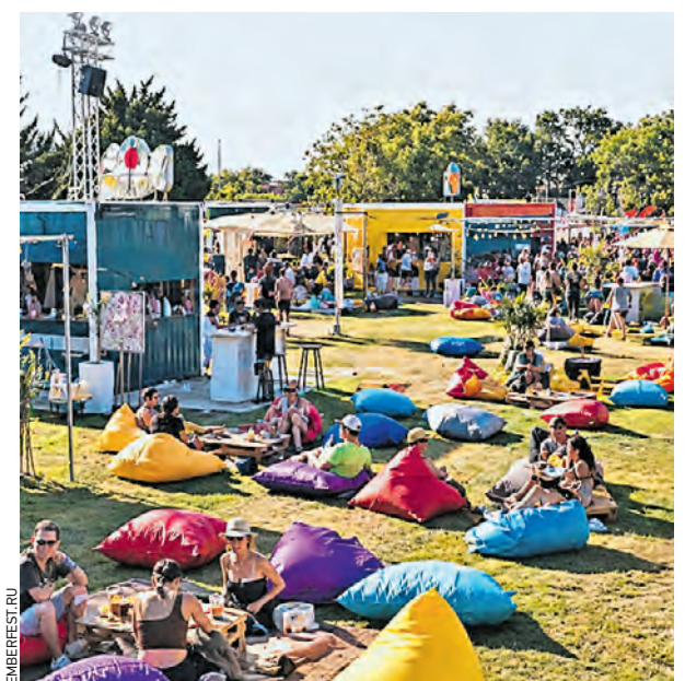
Гости одной из крупнейших в столице фестивальных площадок кинопарка «Москино»