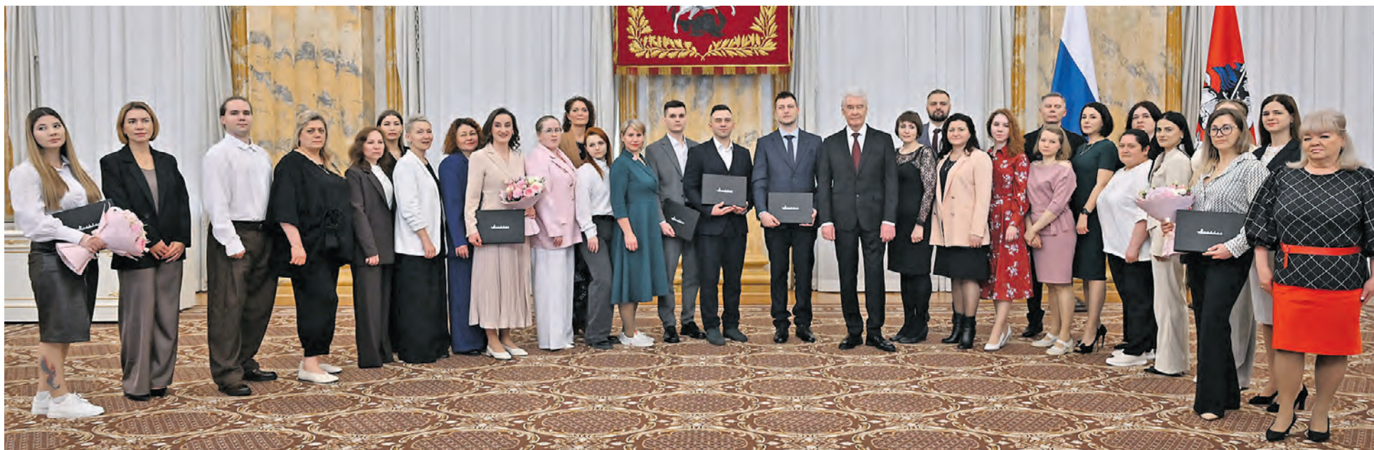
13 мая. Мэр Москвы Сергей Собянин (в центре) поздравил медицинских работников — финалистов конкурса «Московские мастера — 2026»

Лучшим медсестрам, акушеркам и фельдшерам подарили автомобили