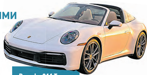
Porsche 911 Targa 24 500 000 рублей