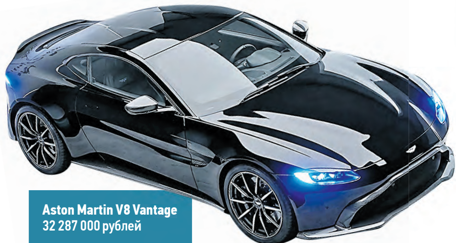
Aston Martin V8 Vantage 32 287 000 рублей

Ее машина: Aston Martin V8 Vantage». Идеальные линии, тонированные стекла, скрывающие бурю эмоций.