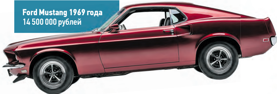
Ford Mustang 1969 года 14 500 000 рублей