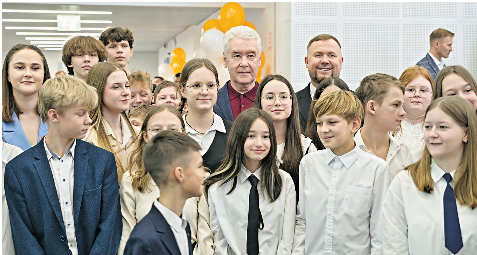
Мэр Москвы Сергей Собянин и директор школы Дмитрий Плужников на открытии нового учебного корпуса школы № 338.

Территорию площадью 117 гектаров в Северо-Западном административном округе Москвы масштабно реорганизуют. Соответствующее постановление о планировке участка утвердило правительство города, сообщил мэр Москвы Сергей Собянин.