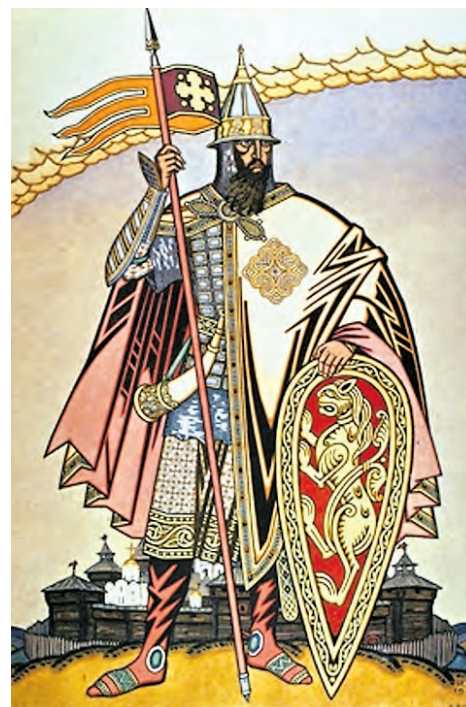
И. Билибин, эскиз костюма к опере А. П. Бородина «Князь Игорь», 1929 год

Разделительные союзы ИЛИ и ЛИБО являются синонимичными и в подавляющем большинстве контекстов могут взаимозаменяться. «В лагере всегда так: или жить не дают, либо ничего не видят и не знают» (Ю. О. Домбровский. «Факкультет ненужных вещей»). В «Грамматике русского языка» отмечается, что сложносочиненные предложения с союзом ЛИБО (одиночным или повторяющимся) по своим структурным особенностям и по общему значению полностью