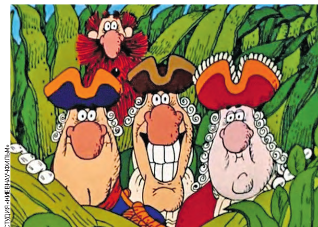
Так Капитан Смоллет, Бен Ганн, Доктор Ливси и Сквайр Трелони (слева направо) выглядели в советском мультфильме 1988 года

В сети уже появился постер-анонс нового «Острова сокровищ». Ленту планируют выпустить в 2029 году